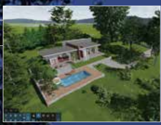
PHOTO MODE カメラモード